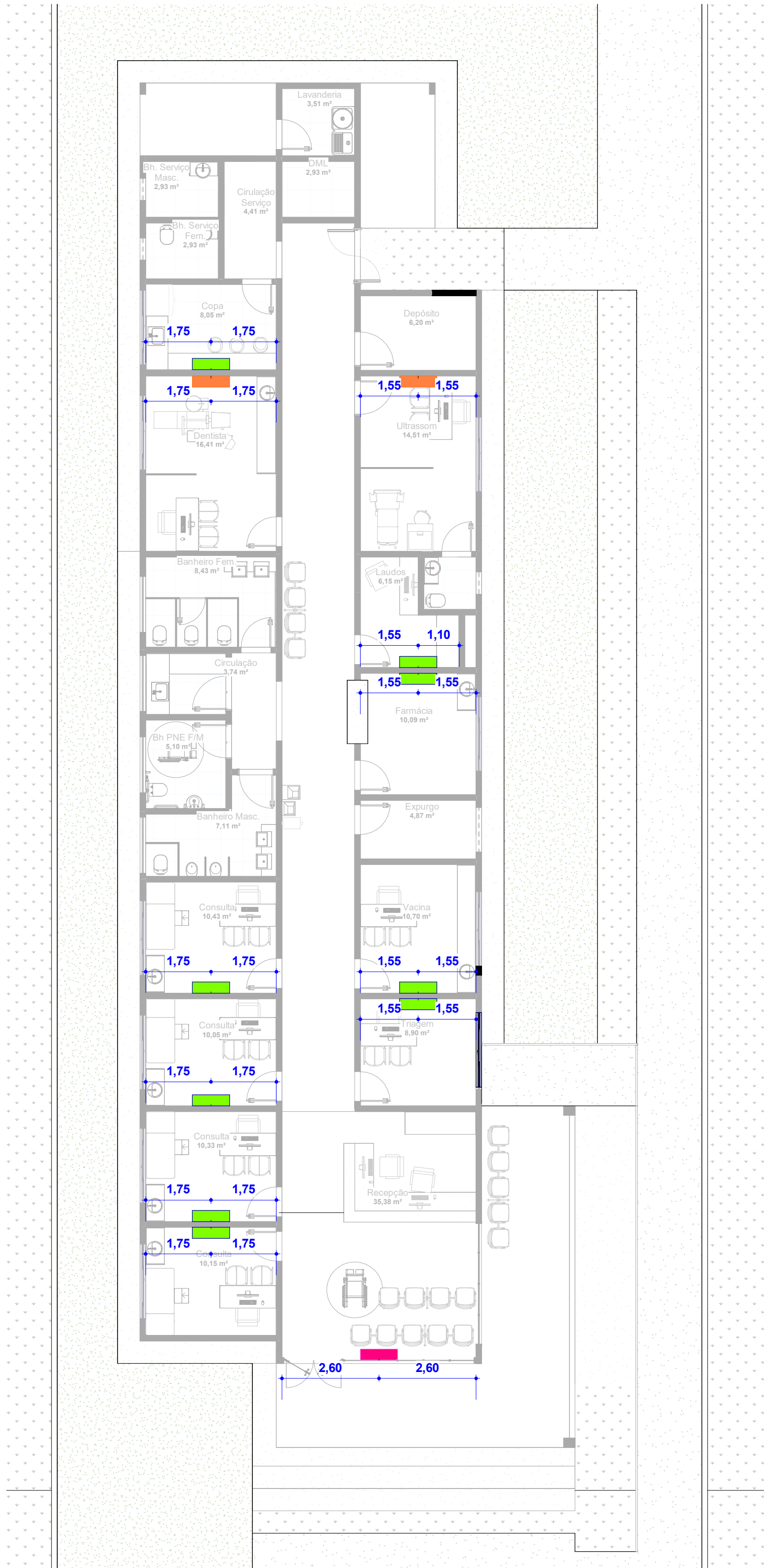
3 PONTO DE AR CONDICIONADO ESCALA 1 : 100